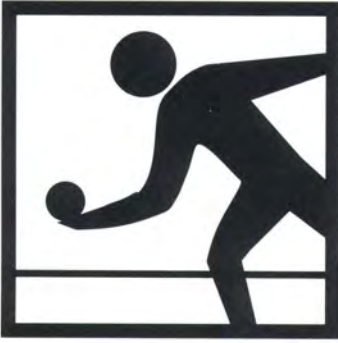
Gioco delle bocce in azienda