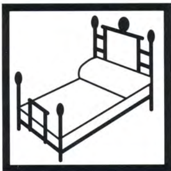
Ospitalità in camere