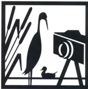
Territorio circostante di notevole valore naturalistico