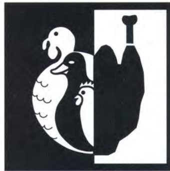
Animali da cortile