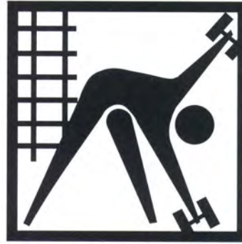
Palestra in azienda