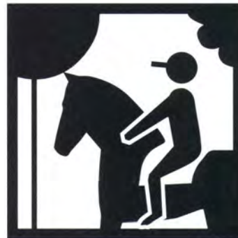
Escursioni a cavallo