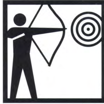
Tiro con l'arco in azienda