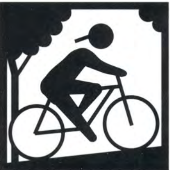
Escursioni in bicicletta