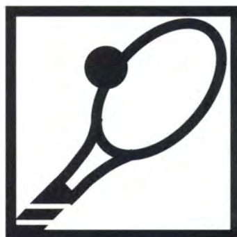
Tennis in azienda