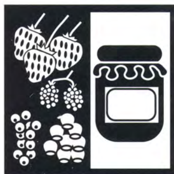
Frutti di bosco e marmellate