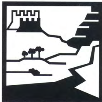
Territorio circostante di valore storico-culturale