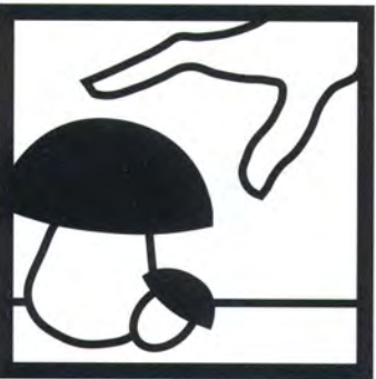
Raccolta funghi in azienda o nelle vicinanze