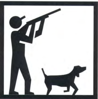
Caccia in azienda o nelle vicinanze