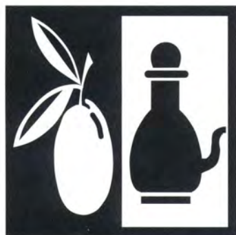
Olio di oliva