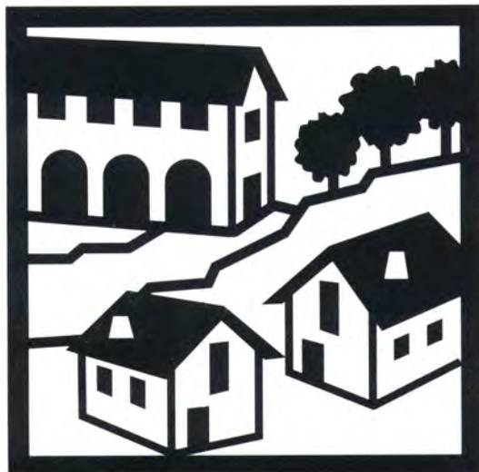
Ospitalità in alloggi indipendenti 75x75 mm

I simboli riportati in questa sezione devono essere tassativamente impiegati con le misure riportate a fianco, relative al lato del quadrato in cui i simboli stessi sono iscritti.