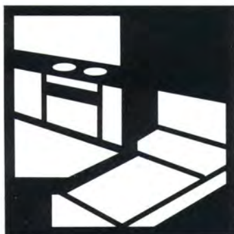
Ospitalità in camere con uso di cucina