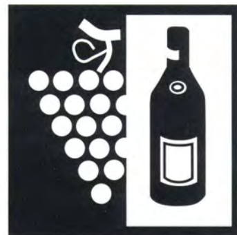
Vino e distillati