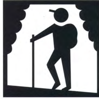
Escursioni a piedi