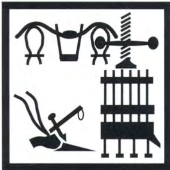
Museo dell'agricoltura in azienda