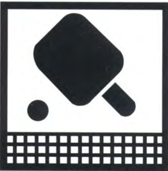
Ping pong in azienda