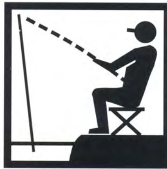
Pesca in azienda o nelle vicinanze