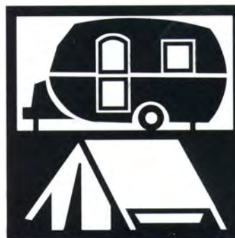
Agricampeggio in azienda