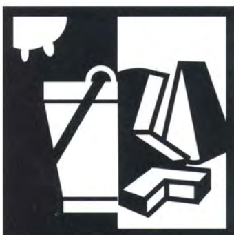
Latte e prodotti caseari