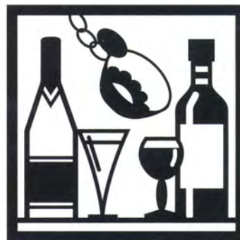
Vini e spumanti DOC