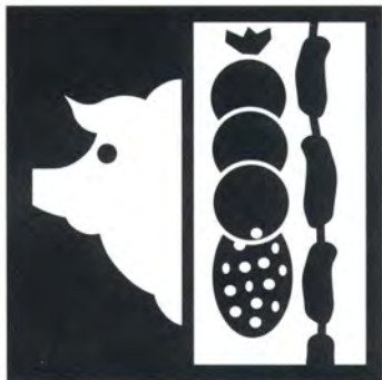
Carni e salumi suini